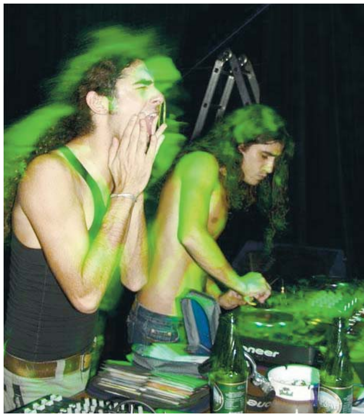
El viernes 7 de agosto en Tantra Noc.

Tal y como lo hacen en varias partes del mundo durante