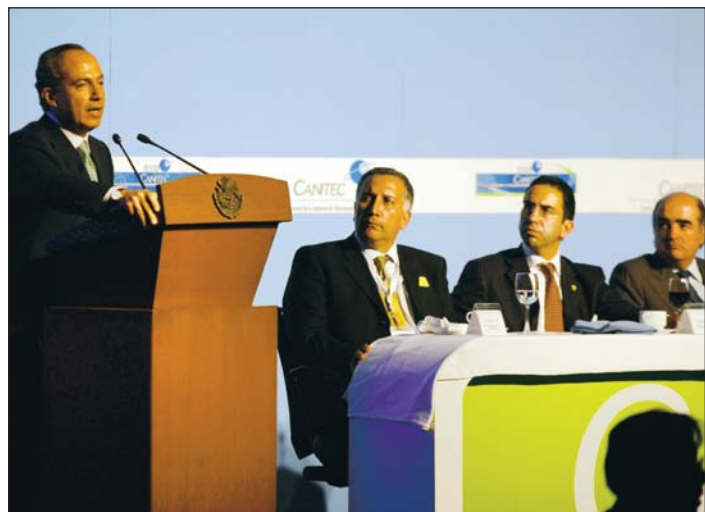
Felipe Calderón aseguró que la política de su gobierno en materia de telecomunicaciones se enfocará a fomentar la competencia.

Otra modificación aprobada y que hoy pasará al pleno de la Cámara para su discusión y análisis, es la relacionada con la Ley Federal de Sanidad Vegetal que establecerá medidas fitosanitarias, regulación de la efectividad de los insumos fitosanitarios y de los medios de control integrado.