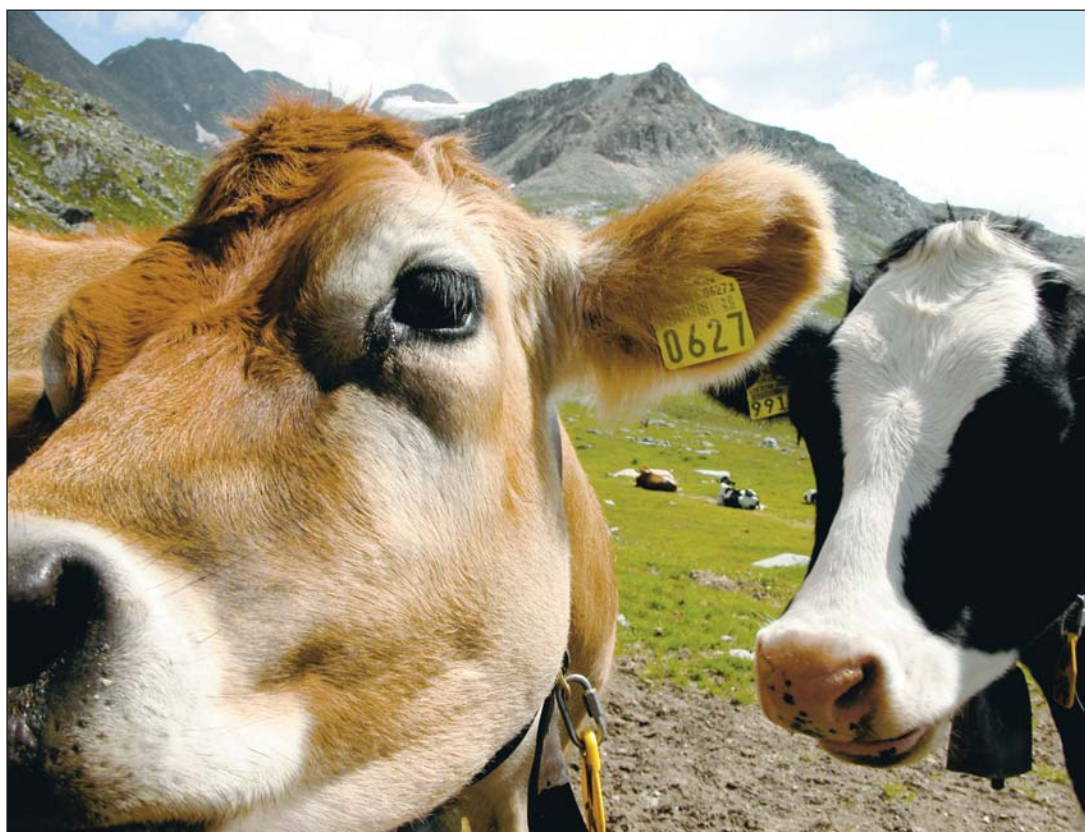
Los créditos podrán ser usados para adquisición de animales y equipo para los ranchos.

Por otro lado, el SAT informó que sus oficinas brindarán servicio los fines de semana restantes de abril, de 9 a 14 horas, para dar apoyo al contribuyente en la presentación de su declaración anual.