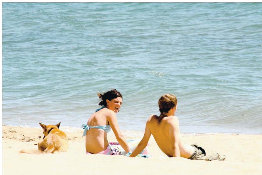
México es el segundo mercado emisor turístico a Estados Unidos.

A partir del próximo año, los estadounidenses que retornen vía terrestre o marítima deben tenerlo