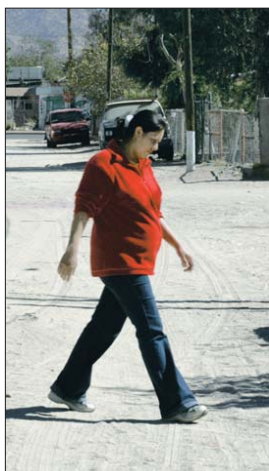
Vecinos de la colonia Mártires de Cananea se quejan de que las calles no están pavimentadas.

Baca Calderón y otros líderes fueron encarcelados, los obreros fueron obligados a regresar al trabajo sin cumplir ninguna de sus demandas, pero Cananea fue el precedente para lograr una mejor vida para el proletariado tras la huelga de Río Blanco.