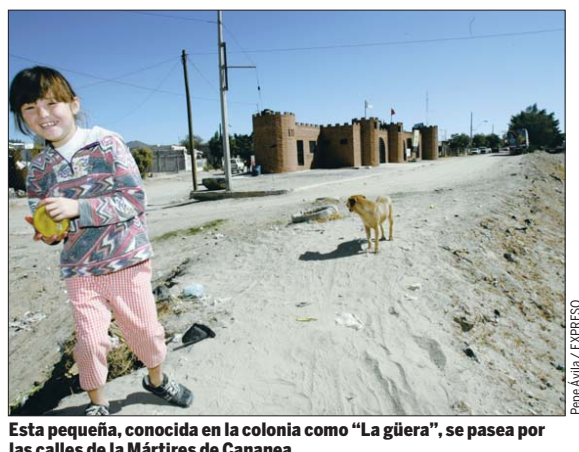
Esta pequeña, conocida en la colonia como “La güera”, se pasea por las calles de la Mártires de Cananea.